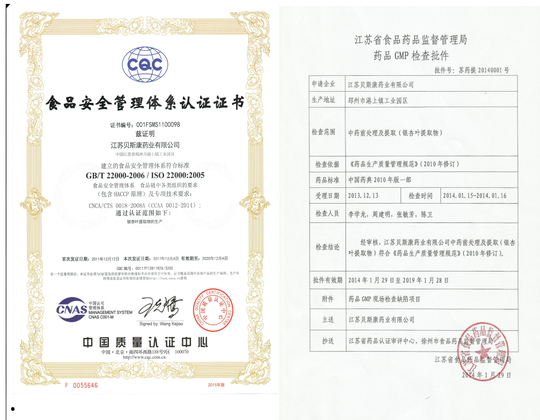
图 2 质量体系认证证书

公司先后通过 HACCP GMP 等质量管理体系认证，贯彻认证工作的开展实施，每年实施监督审查，持续改进完善，不断优化工艺技术改造，提升核心技术，促进技术改革与创新引领行业进步。2015 年通过国家高新技术企业认定；2013 年起连续被认定为 AAA 级守合同重信用企业。