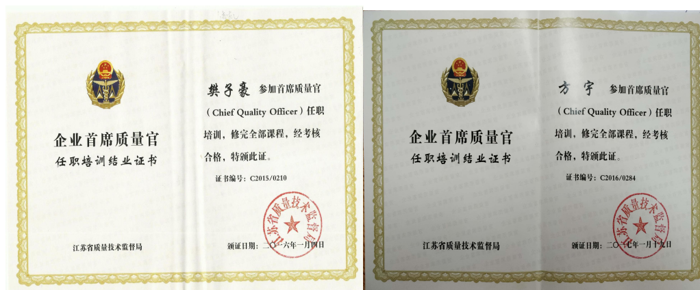
图 1 企业首席质量官培训证书

为保证质量管理体系的有效运行，公司授权质量副总经理为公司质量管理体系的管理者代表，负责公司质量管理体系的建立、实施、保持和改进。并授权生产运行管理部为公司质量管理体系的归口管理部门，公司建立了首席质量官制度，对质量管理体系的运行情况实施监督、检查和考核。公司下设 8 个职能部室和 3 个车间，都设置了专兼职的质量管理员负责质量管理工作，并在全公司范围内明确各级管理者及各岗位员工的质量职责和权限，明确了产品各环节的质量标准、质量控制和质量改进，坚持不懈提高产品质量，持续不断强化质量意识，并通过开展 QC 小组活动、质量效益提升、合理化建议、“质量月”等质量活动。充分调动全员参与的积极性致力于质量建设和改进。